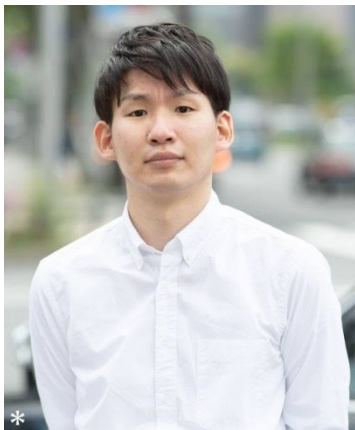
ゼンハイザージャパン株式会社 プロオーディオビジネスユニット Sales Manager